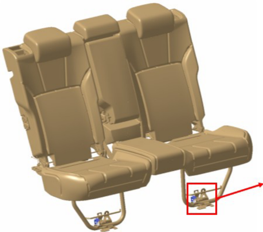
BANCO TRASEIRO DISPOSITIVO MONTADO